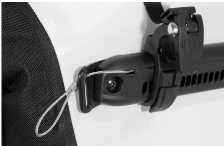
Diebstahlsicherung an Radtasche QL2.1 montiert

Flexibler rostfreier Stahldraht mit Schlaufe für Kabel- oder Bügelschloss