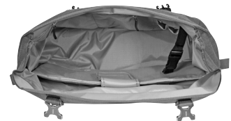
Innenansicht: gepolstertes Innenfach für Notebook