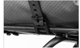
Detailaufnahme Rack-Straps am Gepäckträger montiert

2x O-Strap Rack 520mm mit Klemmhaken zur Montage am Gepäckträger (im Lieferumfang enthalten)