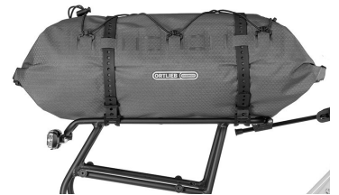
Montiertes Dry-Pack auf dem Gepäckträger