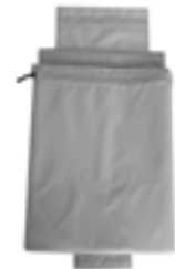
Inkl. Messenger-Bag Laptop Compartment

Infos zu IP-Symbolen: www.ortlieb.com/de/service/technisches/ip-symbol/