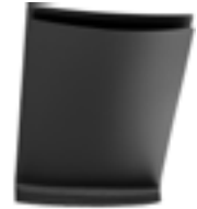
Inkl. Messenger-Bag Compartment A3