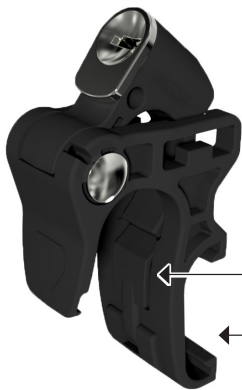
Abbildung im geschlossenen Zustand

Arretierungshaken nur im geöffneten Zustand verstellbar