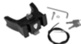
E207 Handlebar Mounting-Set E-Bike with Lock