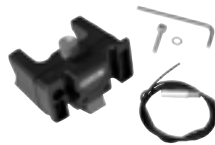
E225 Handlebar Mounting-Set