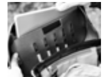
Öffnung Deckelfach: 20,5 cm