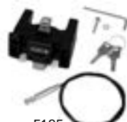
E185 Handlebar Mounting-Set with Lock