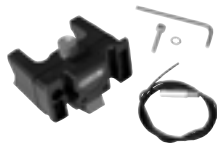
E225 Handlebar Mounting-Set