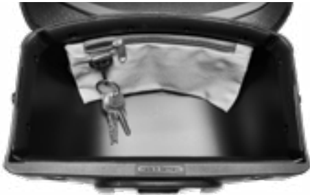
Karabiner mit Schlüsselbund