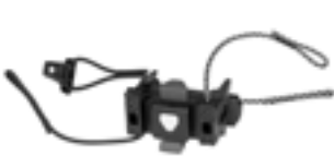
E241 Handlebar Mounting-Set QR