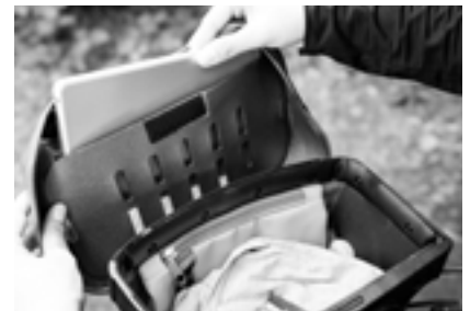
Öffnung Deckelfach: 20,5 cm