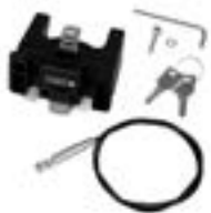
E185 Handlebar Mounting-Set with Lock