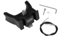
E226 Handlebar Mounting-Set E-Bike