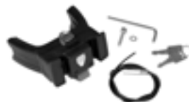
E207 Handlebar Mounting-Set E-Bike with Lock