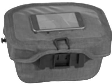
Smartphone im transparenten Deckelfach (nicht enthalten)