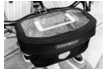
Smartphone im transparenten Deckelfach (nicht enthalten)

MOUNTING-SET REQUIRED! Halterung separat erhältlich