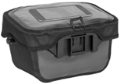
Smartphone im transparenten Deckelfach (nicht enthalten)